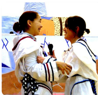
Au Nunavut, de jeunes interprètes de chants gutturaux participent à la partie culturelle inuite du hip hop.