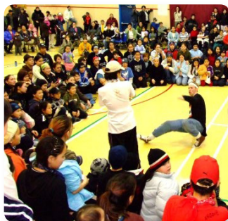
Bataille de break dance lors de la dernière démonstration communautaire, le 12 février.